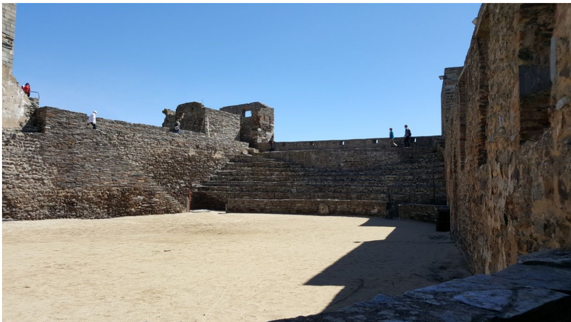
Plaza toros de Monsaraz

En la época árabe se llamó Saris y perteneció al reino árabe de Badajoz.