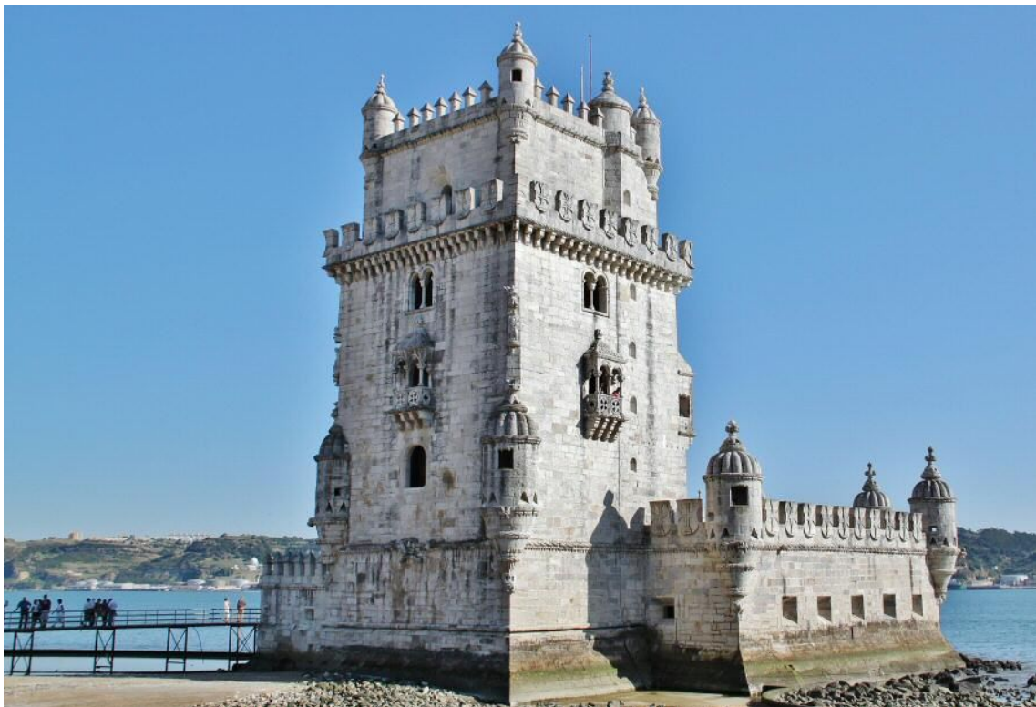
torre de Belen

Hoy el día parece que está en calma y nos vamos a Lisboa, a cantar fados y comer pasteles de Belén, vamos cerca del monumento a los conquistadores que más abajo hay una zona donde se permite acampar a las ACS, la mitad llena de vehículos, todas las ACS de franceses e ingleses, y ni una sola portuguesa o española