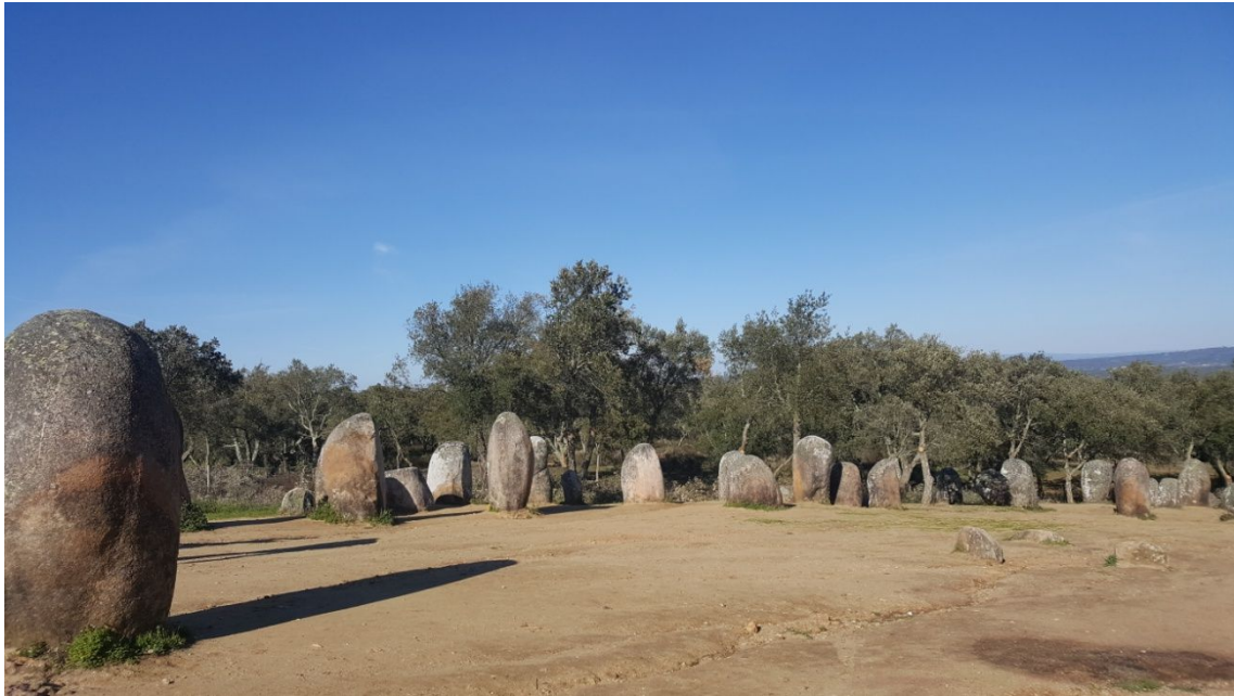
Cromlech de los Almendros

Por último el dolmen de Pavía que es un dolmen cristianizado, donde en su interior hay una capilla con un altar de azulejos, impresionante el dolmen