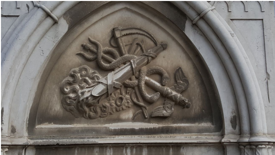
Simbolos masónicos Cementerio Placeres

Tumbas que parecen habitadas ,con sus visillos en los cristales y una muy impresionante, la de una víctima del ataque yihadista de la Sala Bataclan con un epitafio en francés