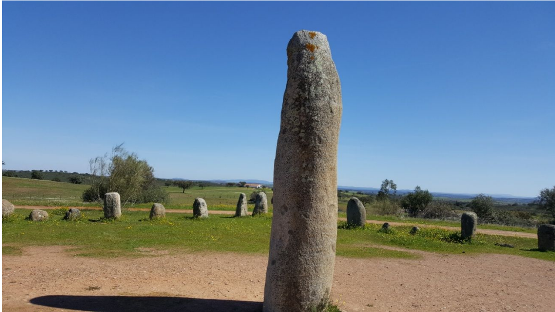
Cromlech de Xarez

Portugal, con Juan IV, a partir de la entronización los reyes de Portugal, a su heredero al trono lo llamaban Duque de Braganza tradición que siguió hasta la época de la República