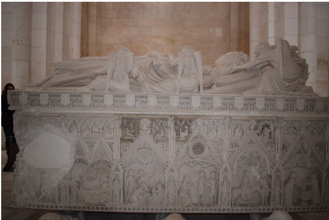
Tumba de Ines de Castro(Alcobasa)

El Monasterio estaba en Huelga y pudimos acceder solo al templo, cominos en un restaurante pequeño y acogedor con una cocina de lujo