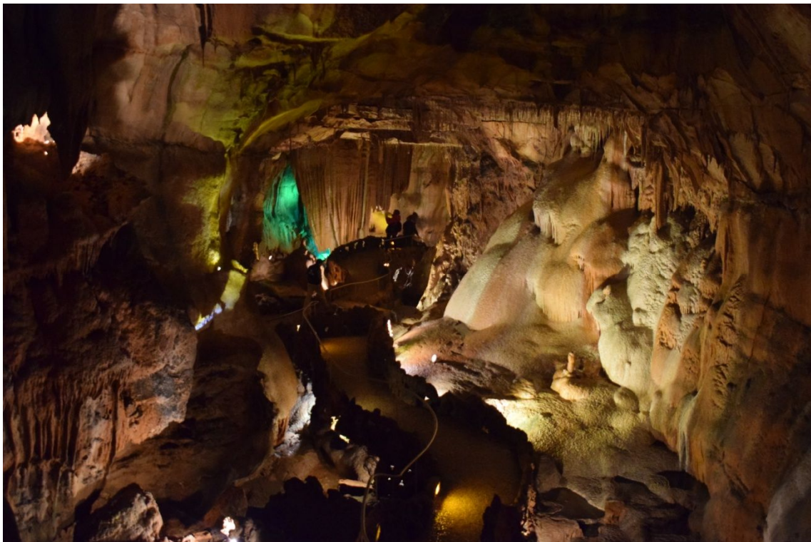
Gruta de Mira Aire

La cueva tiene como nombre “Los molinos bellos”, se abrieron al público en 1974 , son las más grandes de