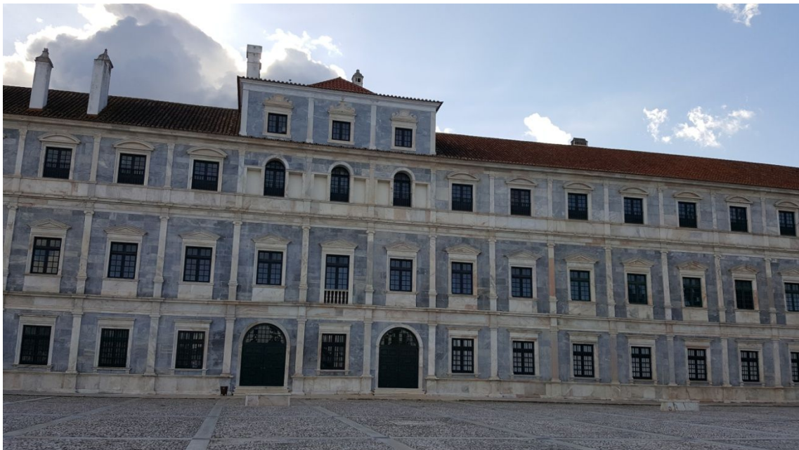
Castillo Duques de Braganza

En Estremoz podemos ver su magnífica plaza y el Castillo N38° 50'34'' W7° 35'08'