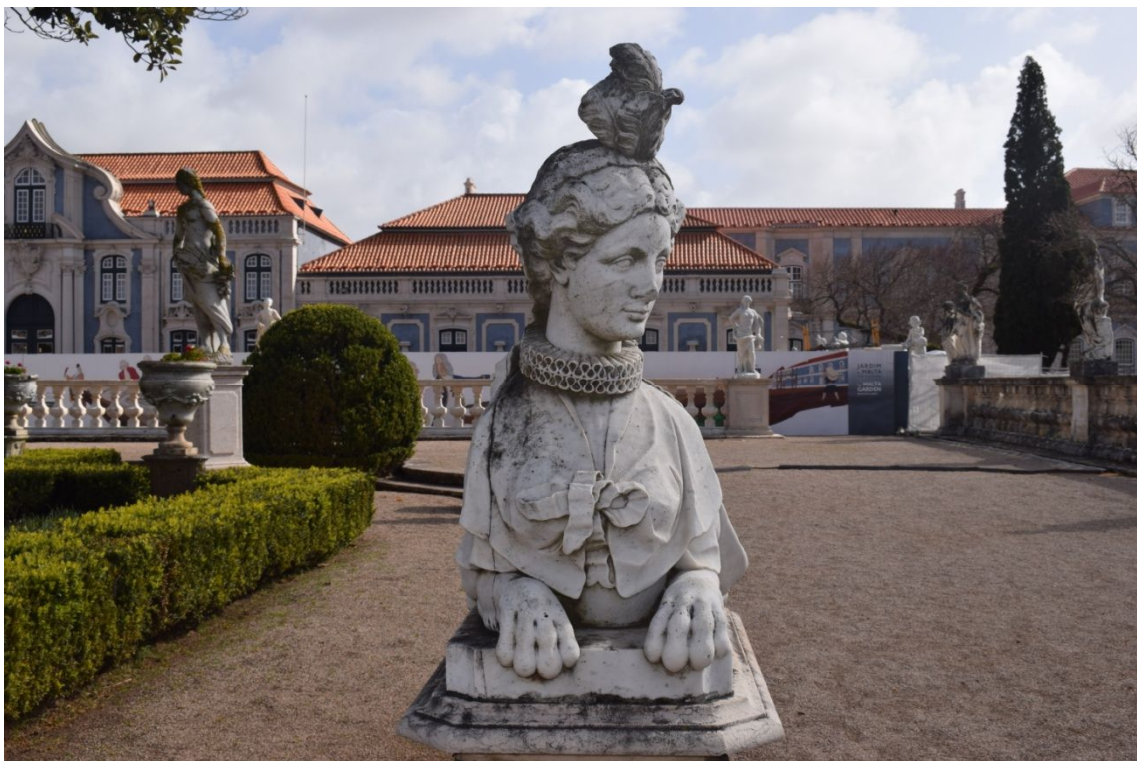
Palacio Nacional de Queluz

Con la ocupación francesa se deterioro mucho por abandonarlo por las construcciones de varios palacios en Sintra