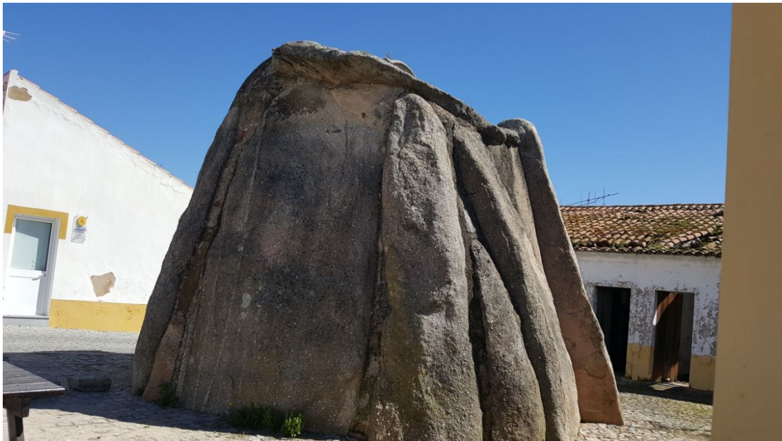
Dolmen de Pavia

Sus murallas son impresionantes y las vistas más impresionantes aun, calles recónditas y casitas blancas, el problema fue que no encontramos restaurante para comer, todo completo